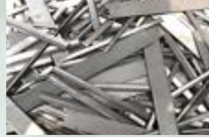
Stainless SUS 304 Scrap