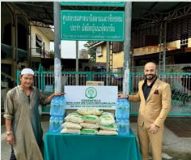
Jannatul Naim Mosque, Phra Nakhon Si Ayutthaya