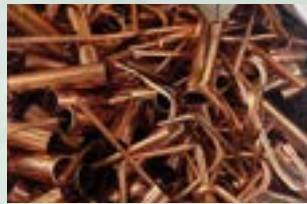
Copper Candy Scrap 99.50%