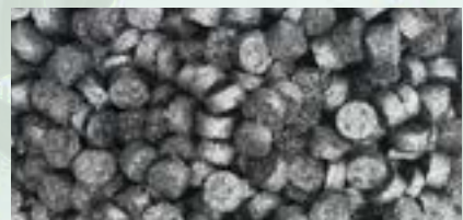
Steel Turning Pucks