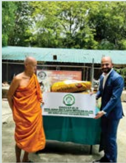
Wat Tanod Dog Rescue and Shelter, Ang Thong