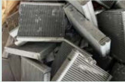
Aluminum Scrap 3000 Series 3003, 3004, 3104, 3102, 3105