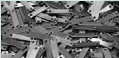
Steel Stamping Scrap