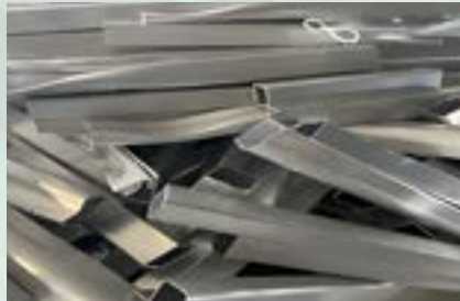
Aluminum Scrap 6000 Series 6061, 6063, 6082