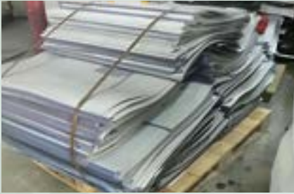
Aluminum Scrap 1000 Series 1050, 1060, 1100, 1200, 1235, 1145