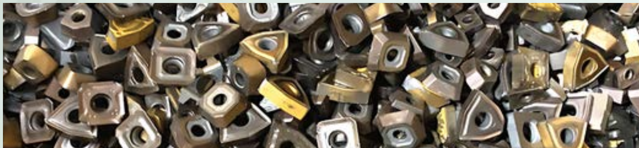
Tungsten Carbide Scrap