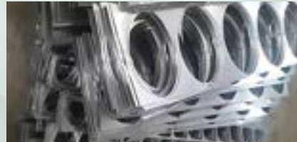
Stainless Steel 430 Scrap