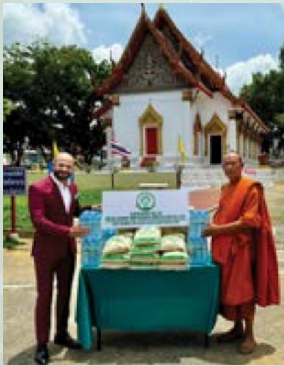
Wat Racha Praditsathan, Phra Nakhon Si Ayutthaya