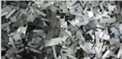
Stainless SUS 316 Scrap