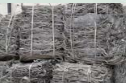
Aluminum Wire Scrap

Note: Fe attached less than 3-5%, Stainless, No specks of dirt, rustiness, redness, Clean material only