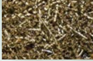
Brass Turning Chips Scrap

Note: Oil moisture is less than 3%. No mixture of material