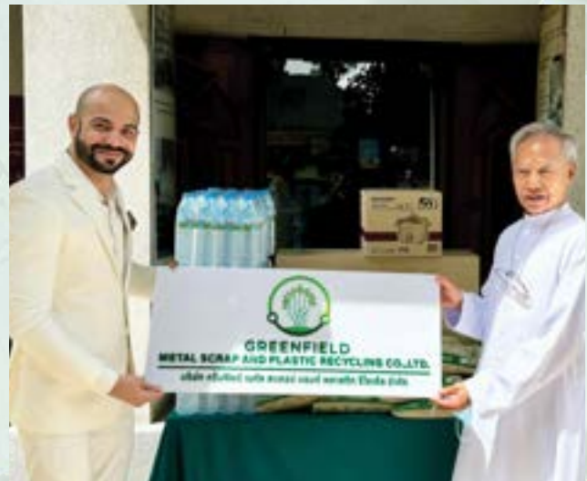
Saint Joseph Catholic Church, Phra Nakhon Si Ayutthaya