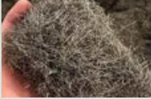
Tire steel Wire Scrap Impurities 2% - 5%, No redness, No rust