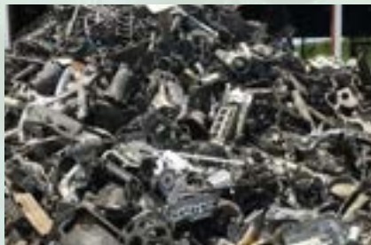
Aluminum Taint Tabor Scrap