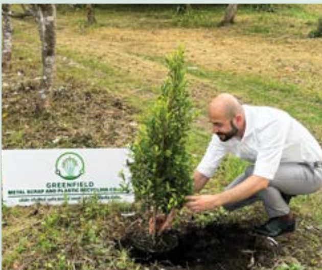
Bueng Phra Ram Park, Phra Nakhon Si Ayutthaya