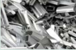
Stainless SUS 201 Scrap