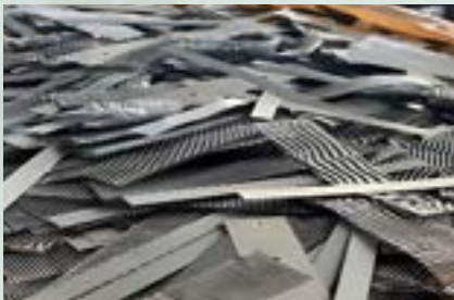
Aluminum Scrap 8000 Series 8011