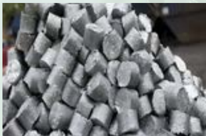
Aluminum pucks Scrap

Note: Oil moisture is less than 3%. No attachment or mixing of Fe, Stainless, or Copper