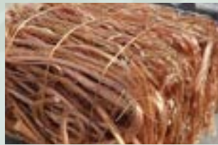
Copper Millberry Scrap 99.50%