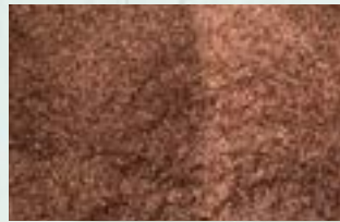
Copper Powder Scrap