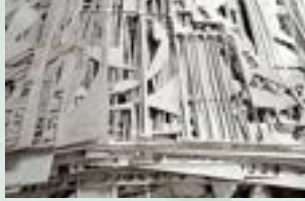
Stainless SUS 301 Scrap