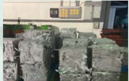
Aluminum Scrap 7000 Series 7050, 7075