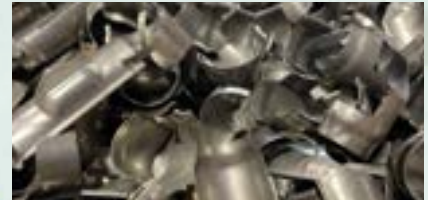
Stainless Steel 410 Scrap