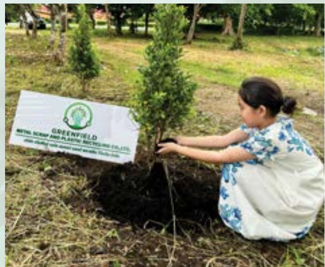
Bueng Phra Ram Park, Phra Nakhon Si Ayutthaya