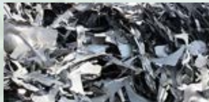
Steel Bushelling Scrap