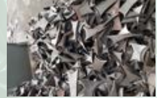
Stainless SUS 310 Scrap