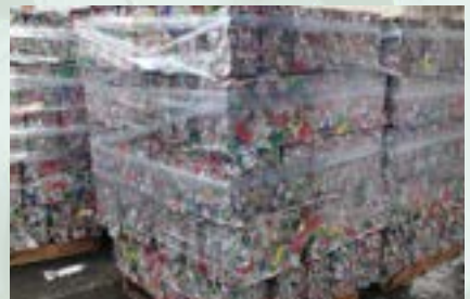
Aluminum UBC Scrap

Note: 1. Impurities less than 2% 2. Aluminum percentage above 96%