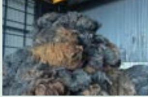
Pyrolysis Tire Steel