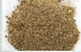
Brass Powder Scrap

Note: Oil moisture is less than 3%. No mixture of material