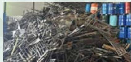
HMS Heavy Melting Scrap