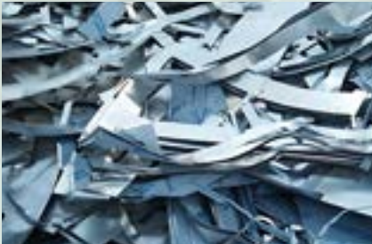
Aluminum Scrap 5000 Series 5086, 5182, 5005, 5754, 5052, 5083, 5A05, 5A06, 5454