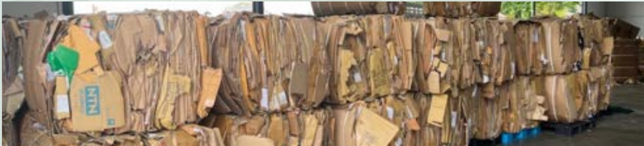
OCC Paper - old corrugated cardboard