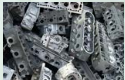
Aluminum Engine Scrap

1. No attachment of Fe, Stainless, Copper, or Brass. 2. Al Percentage above 96 %