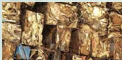
LMS Light Melting Scrap