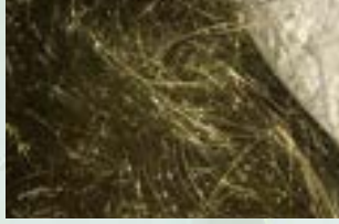
Brass Wire-Cut Scrap