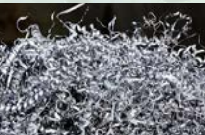
Aluminum Turning Chips Scrap

Note: 1. Impurities less than 2% 2. Aluminum percentage above 96%