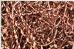
Copper Turning Chips Scrap Note: Oil moisture is less than 3%. No-mix material