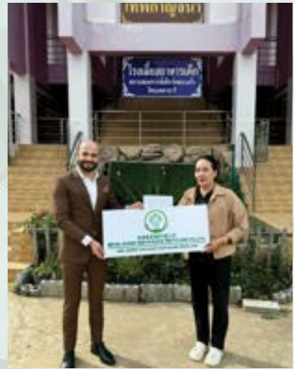
Wat Sakaew Orphanage, Phra Nakhon Si Ayutthaya