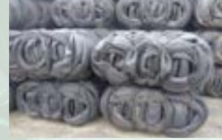
Tire Scrap baled Scrap