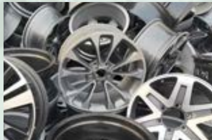
Aluminum Alloy Wheel Scrap