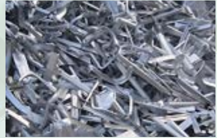
Aluminum Scrap 4000 Series 4017