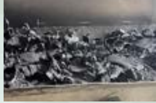
Shredded Tire Scrap