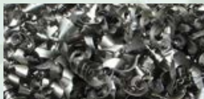
Steel Turning chips Scrap